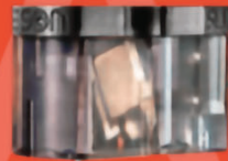
Cellule Le Son SL1 MKII