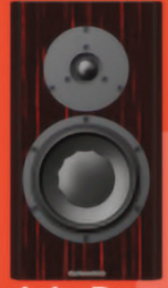
Enceinte Dynaudio Special Forty