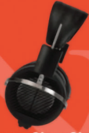
Casque Stax Stax SR-X1